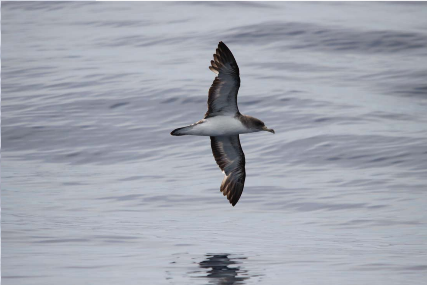
Puffin cendré ( Calonectris diomedea )